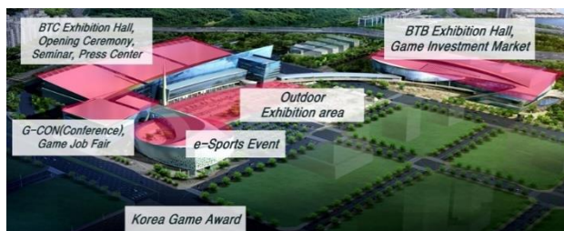
図 3 フロアマップ (G-STAR 2018)